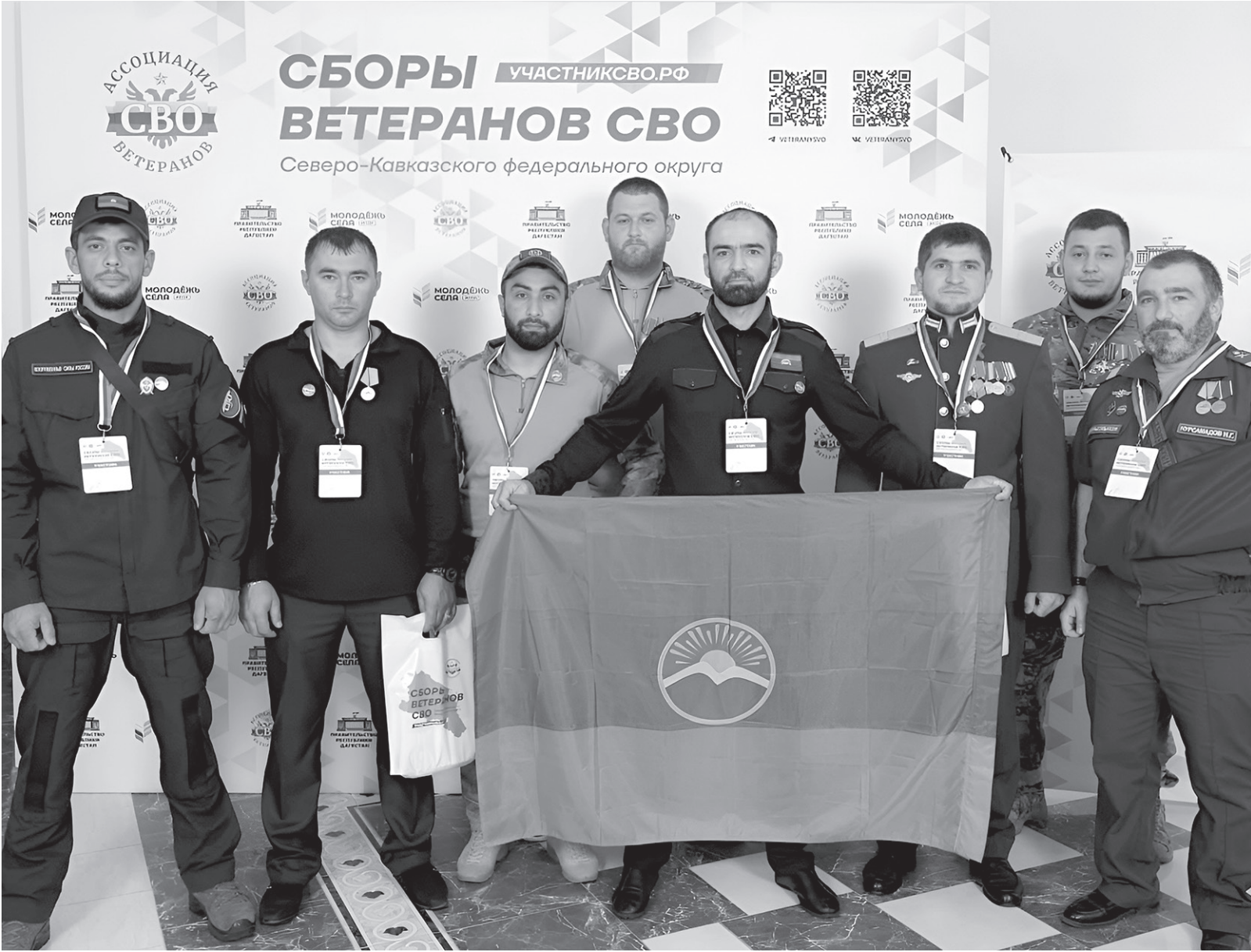
Участники и ветераны специальной военной операции из КЧР на сборах в Махачкале

В Махачкале прошли первые сборы Ассоциации ветеранов спецоперации Северного Кавказа