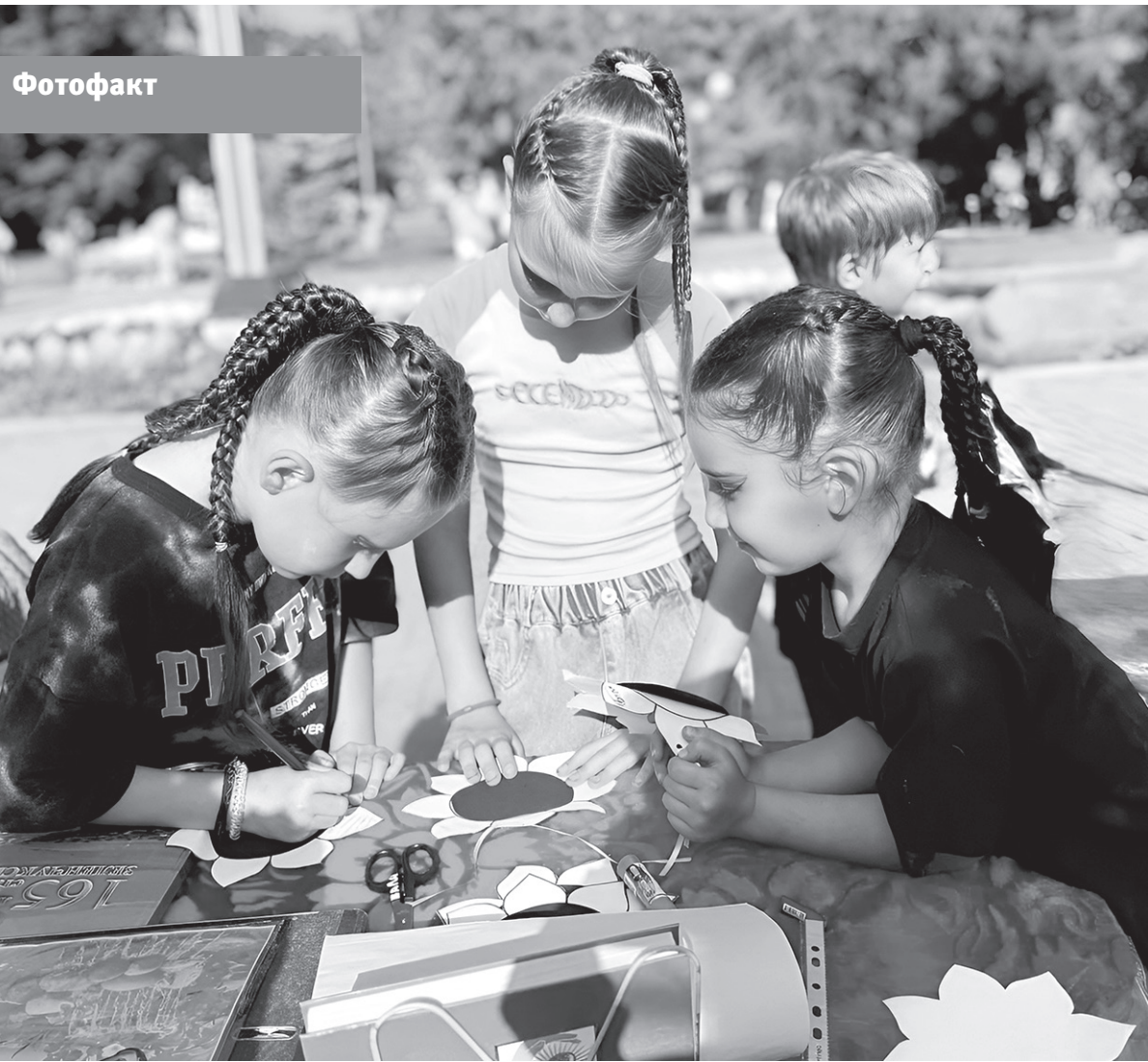
Зеленчукская центральная библиотека провела ряд тематических мероприятий ко Дню станицы Зеленчукской. На центральной аллее парковой зоны была оформлена книжная выставка «К родной станице с любовью». Посетители изучали издания, открывая для себя новые грани истории и культуры родного края. Также специалисты библиотеки провели акцию «Зеленчукская моя, милая сторонка». Внимание посетителей привлекли этноэкспозиция и мини-музей с представленными предметами быта, старинными фотографиями и другими экспонатами, рассказывающими о жизни станицы в разные периоды.